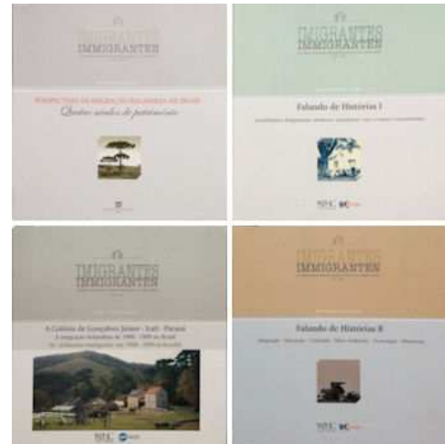
Afb 9 Boeken over Nederlandse immigranten