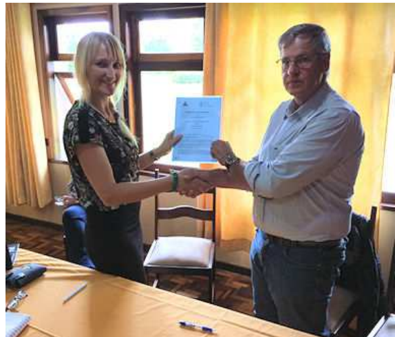
Afb 8 Ondertekening MoU in Castrolanda

Er blijkt, net als in Holambra, meer archief te zijn dat verband houdt met de geschiedenis van Castrolanda en dat dus met elkaar samenhangt. Er is grote behoefte bij alle partijen om dit op een deugdelijke manier te inventariseren, beschrijven en digitaliseren. Er is ook behoefte de objecten van het museum te beschrijven en digitaliseren. Zoals vermeld valt de vorming van het Centro Cultural onder de cultuurwet, 'Lei Rouanet'; dat betekent dat mogelijke sponsors het bedrag dat ze schenken van de belasting kunnen aftrekken en deze status is mogelijk ook interessant voor Museu Holambra. De AMC werft fondsen voor de inrichting van het in aanbouw zijnde nieuwe museum en ook digitalisering van het museumarchief en collectie. In het nieuwe museum komt ook een betere opslag en werkruimte voor het archief.