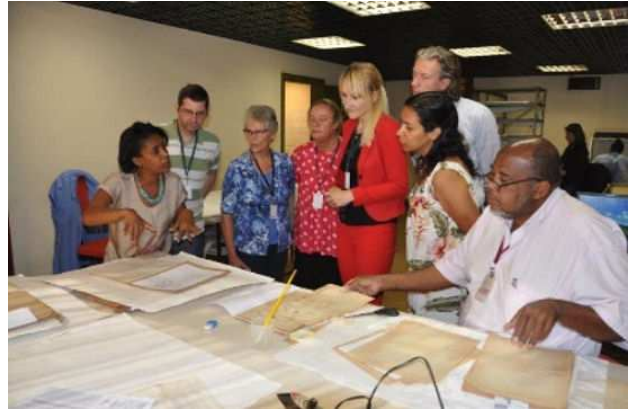
Afb 1 Conserveringswerkzaamheden aan het archief van de NVR