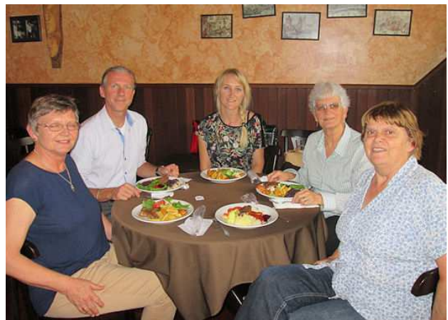
Afb 6 Met de dames van het archief in Castrolanda

Het archief van het museum is divers en bestaat uit foto's, brieven, artikelen, tijdschriften. De drie genoemde dames houden zich op wekelijkse basis actief bezig met het archief. Ze scannen foto's en zijn bezig om een