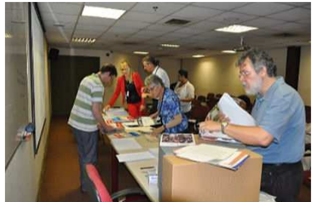
Afb 3 Ordenen van het archief

De tweede dag van de workshop was er tijd om met het archiefmateriaal zelf aan de slag te gaan. Er werd gestart met het gezamenlijk invoeren van de hoogste niveaus van de inventaris (archiefstelling, archief, fonds) in ICA-AtoM in het Portugees (als deze inventaris klaar is dan moet deze worden vertaald in het Nederlands). Daarna is besloten om het verenigingsbulletin 'Onder ons' als eerste te ordenen, te inventariseren en opnieuw te verpakken. Er bleken edities te ontbreken, maar ook dubbele te zijn. Van de dubbelen werd slechts één exemplaar in het archief gehouden. Een lijst van ontbrekende edities werd ter plaatse aangelegd en tenslotte werden de edities opnieuw verpakt in papieren omslagen en een aantal zuurvrije dozen, ter beschikking gesteld door het AN.