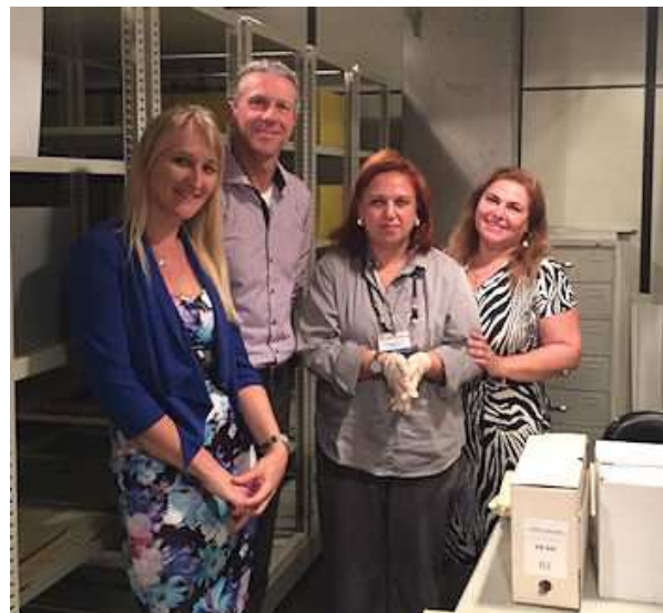
Afb 8 Bezoek Staatsarchief Parana

DEAP kent de archiefbeschrijvingstool ICA-AtoM wel, maar gebruiken dit in de praktijk nog niet en kunnen dus geen workshop op dit gebied bieden. Zij brengen hun archiefdata onder in een eigen archiefsysteem genaamd Documentador waarvoor zij wel een workshop kunnen bieden. DEAP neemt samen met andere archiefinstellingen in Paraná diensten (en dus ook deze software ontwikkeling) af van een ICT-bedrijf. Documentador is geschikt om via internet te kunnen inloggen en dus vanaf elke locatie beschrijvingen te kunnen invoeren. Het is niet primair bedoeld als beeldbank. Het blijft de vraag in hoeverre het mogelijk en wenselijk is om het archief van Castrolanda digitaal onder te brengen bij DEAP en hun systemen. Hier moet meer onderzoek naar gedaan worden.