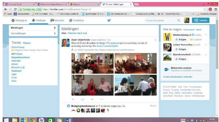
Afb 4 Tweet van de Consul Generaal over het TULIPANA programma